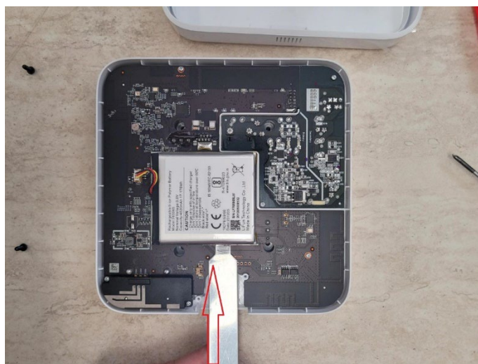
4. ábra Az akkumulátor eltávolítása

Fokozatosan és óvatosan kell a tompavégű szerszámot az akkumulátor alatt tolni, nehogy felsértsük a nyáklapot vagy az akkumulátort vele, nem szabad hirtelen megtolni sem mert elég erős a ragasztó az akkumulátor alatt és ha hirtelen elenged(ne), akkor a szerszám „megszaladhat” a nyáklapba vagy valamelyik alkatrészbe, és javíthatatlan kárt okozhat.