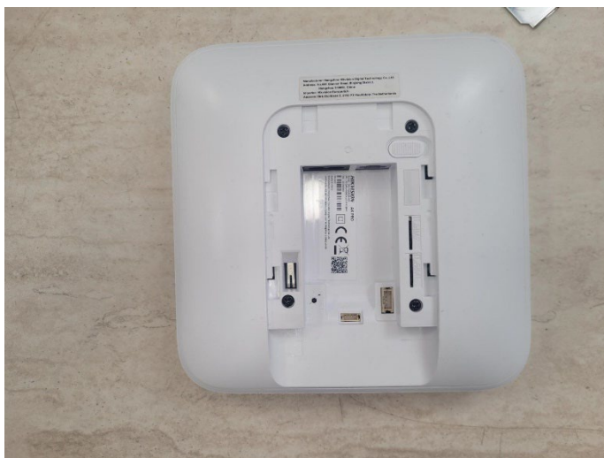
2. ábra Hátlap eltávolítva