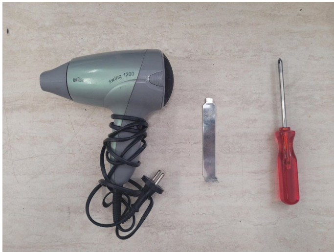
1. ábra Szükséges szerszámok