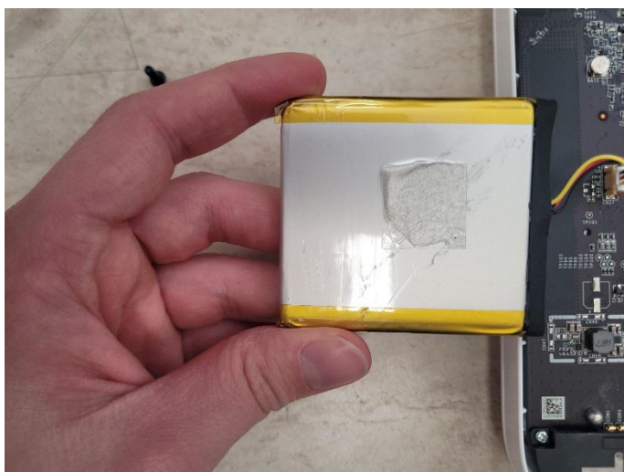
5. ábra A ragasztó elhelyezkedése